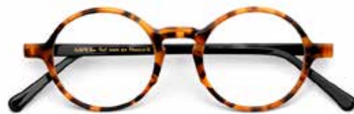
— COLLECTION JUSTE — Bio-acétate biodégradable - Origine France Garantie

PROFITEZ DES OFFRES EXCLUSIVES JUSQU'AU 31 DÉCEMBRE 2024