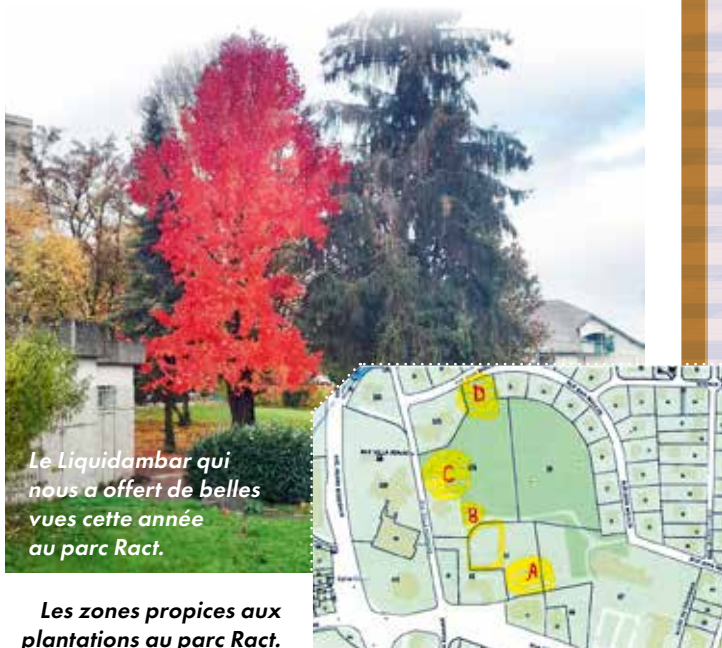
Le Liquidambar qui nous a offert de belles vues cette année au parc Ract.

"Nous espérons que les écoles de Cognin sauront trouver là des postes d'observation privilégiés de la nature et de la biodiversité. Avis aux amateurs !".